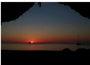
Cala Goloritzè 📍 Grotta del Fico 📍 Santa Maria Navarrese 📍