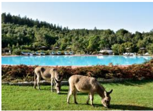
Golf d'Orosei 📍 Cala Goloritzè 📍